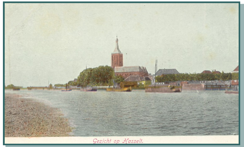
Gezicht op Hasselt.

Zwartewater in haar handen lag. Toen dan ook in de negentiende eeuw de monding van de rivier uitgebaggerd moest worden om er voor te zorgen dat schepen met een grotere diepgang de hoofdstad zouden kunnen blijven bereiken, werd door Zwolle