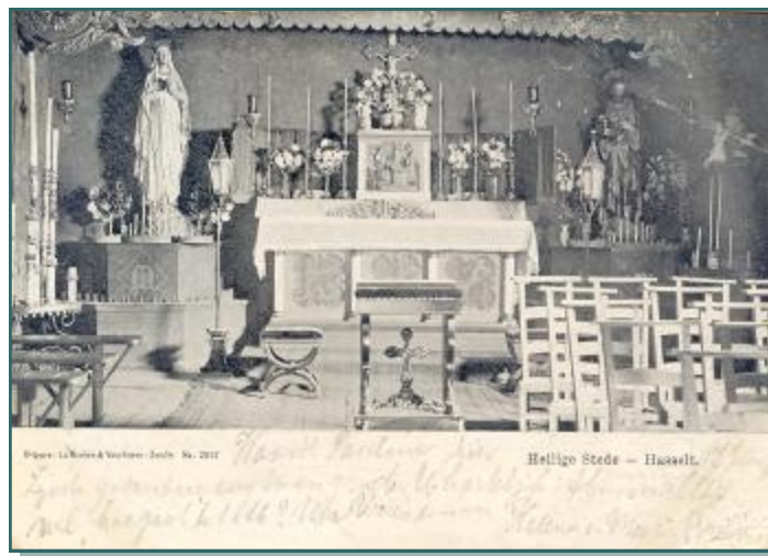
Dijon: La Motte &amp; Vachon - Joche - No. 2017

druk bezocht. Ze tekenden aan dat ook pastoor Groeningen aanwezig was. De kaarten zijn gedateerd op 25 juni 1905 en 17 juni 1906. Uit de adressering is op te maken dat beide dames niet in Hasselt logeerden, maar in Kampen. Daar hadden ze kamers gehuurd in Hôtel des Pays Bas.