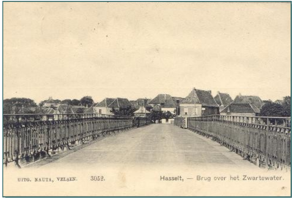
UITG. NAUTA, VELSEN. 3052.