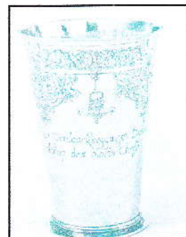
Avondmaalsbeker van de Grote Kerk

Men vroeg ontheffing hiervan en verzocht de magistraat tevens om de achterstallige bedragen in de lege diaconiekist weer te storten.