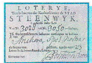
Loterijbriefje uit Steenwijk

Zo organiseerde in 1711 de zilversmid Verstelt uit Zwolle in Hasselt een loterij. In totaal ging het daarbij om 6.900 loten van negentien stuiver per