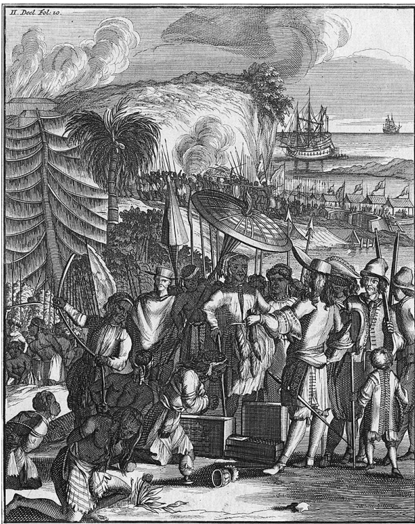
Inwoners uit Arakan verkopen in het Indiase Orissa slaven aan koopmannen van de VOC (1663, Wouter Schouten)

Vanuit hier maakte het handelsreizen naar