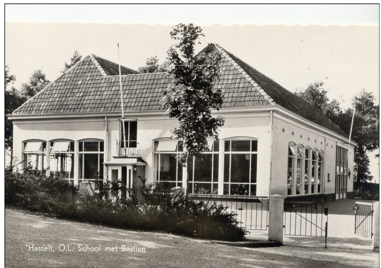
Hasselt, O.L. School met Bestien

De benodigde gelden kwamen van het natio-