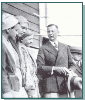
Opening van het zwembad