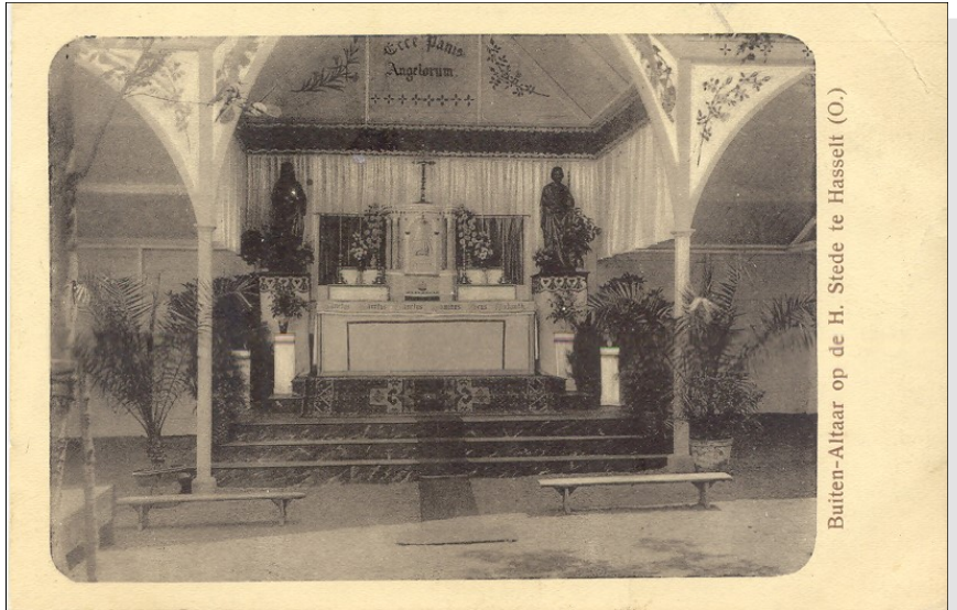
Buiten-Altair op de H. Stede te Hasselt (O.)

Het is diezelfde oorsprongleggende die de auteur van het katern 'Hasselt: van Kruisvaarders en Pelgrims' hanteert. Bij het lezen ervan dringt zich het idee van een tunnelvisie op. Een verschijnsel dat soms ook opdoemt bij gerechtelijke onderzoeken, waarbij de bewijzen geduwd worden richting een vooraf gewenste uitkomst. Daarbij worden niet welkome gegevens genegeerd en andere juist uitvergroet. Dat is duidelijk met dit artikel het geval. Caesarius was geen geschiedschrijver. Hij was een geestelijke. Wonderen en feiten lagen bij hem in elkaars verlengde. Zijn doel was niet om een geschiedenisverhaal te schrijven, maar om te preken. Zijn verhalen dienden uitsluitend een godsdienstig doel. Dat neemt niet weg dat sommige erin voorkomende gegevens historisch en geografisch betrouwbaar