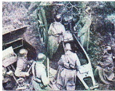
Een 7 veldkanon. Rechtsonder is de plaats van de wachtmeester.