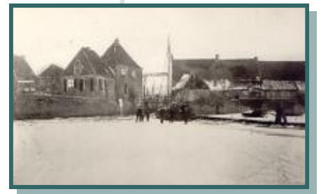
Ingang gracht. De panden staan op de kademuren