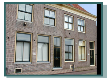
Woning van Coenraad

Vrijmetselaars in Hasselt hebben een belangrijke bijdrage geleverd aan de groei en welvaart van de Hasselt in de eerste helft van de negentiende eeuw.