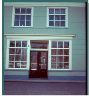
Woning van Gerrit Freislich

gehouden feestredes en de gezongen liederen zijn later in druk verschenen.