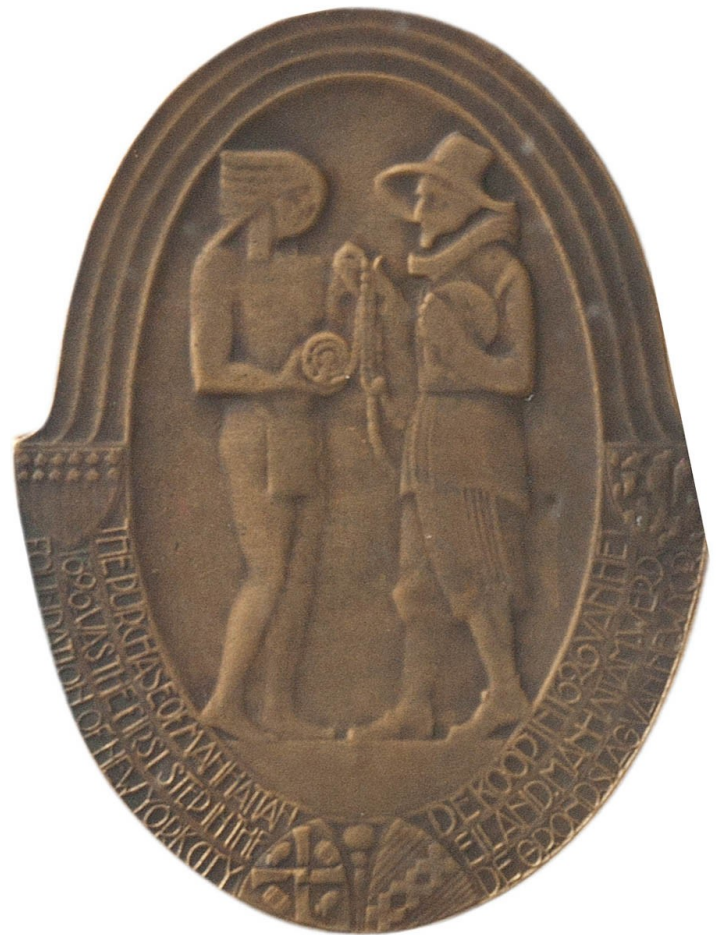
300 jaar stichting New York. Penning Begeer 1926.