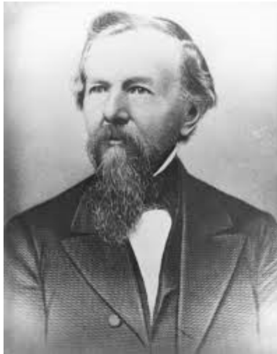
Dominee Van Raalte

Lespinasse hals overkop naar de Verenigde Staten. Waarschijnlijk om hiermee een huwelijkschandaal te voorkomen. De dokter hield het met zijn huishoudster. Scheiden was in die tijd niet gemakkelijk en dus veelal geen optie. Bovendien was zij beneden zijn stand. Dus vluchtte hij in 1870 naar de VS. (zie Histovisie 3.1.)