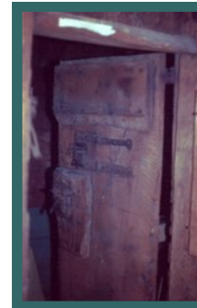
Kamer voor de gevangenen

En meer dan 100 jaar later vond op de trappen en de aanpalende kamers een oproer plaats (1706). Hier gingen beroemde figuren naar binnen (Maurits, Lodewijk Napoleon), maar ook schurken zoals Gerrit Ludgers van Oldenhove (2 mijlen boven Groningen). Hij werd in 1571 gearresteerd, omdat hij en zijn kompanen er de gewoonte van hadden gemaakt om kerken leeg te roven.