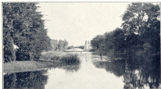
KIJKJE IN 'T BOLWERK -- HASSELT.

Zo zag Hasselt er eind negentiende tot aan het midden van de twintigste eeuw uit